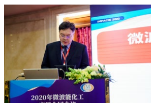
主任委员四川大学黄卡玛教授做先进微波加热技术及化工应用的大会报告